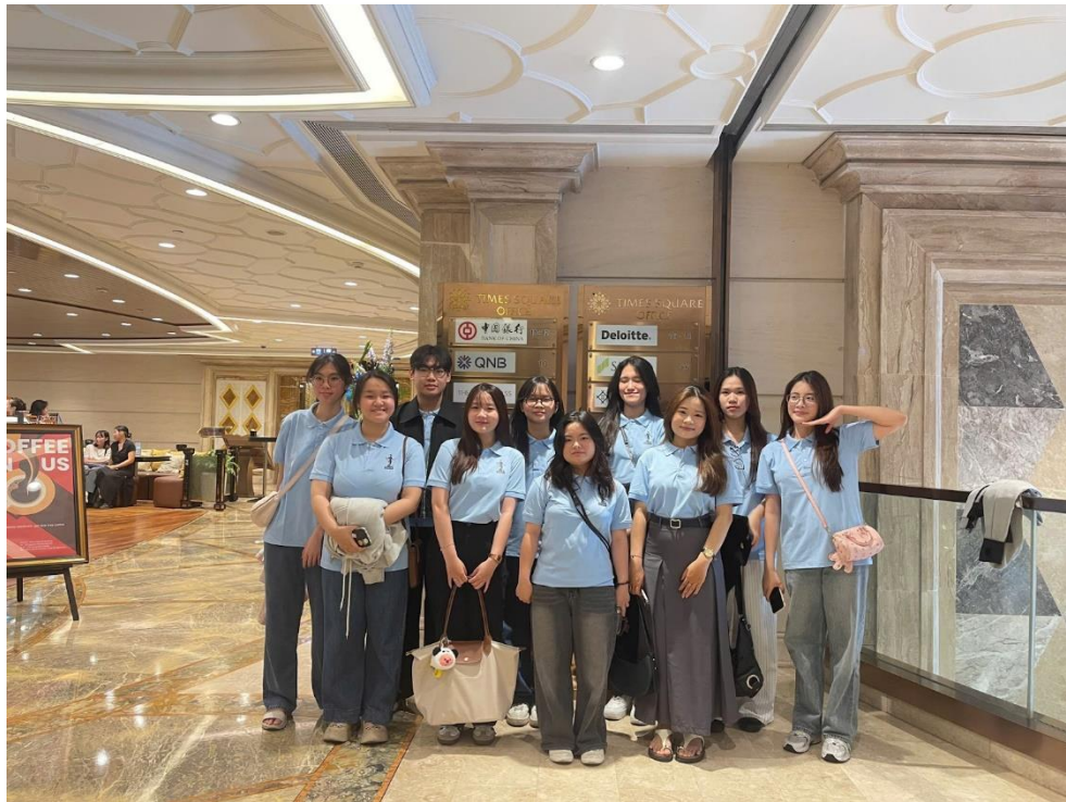
Nhóm sinh viên K50 chương trình Kế Toán Tích Hợp Chứng Chỉ Nghề Nghiệp Quốc Tế ICAEW UEH

Chuyến tham quan lần này có sự tham gia của sinh viên UEH cùng các bạn đến từ Trường Đại học Kinh tế - Luật và Trường Đại học Tôn Đức Thắng. Tại đây, các bạn sinh viên đã có dịp trực tiếp khám phá môi trường làm việc thực tế tại Deloitte, giao lưu và lắng nghe những chia sẻ truyền cảm hứng từ chính những nhân sự đang công tác tại Deloitte. Những câu chuyện nghề nghiệp chân thực, những bài học kinh nghiệm quý giá từ các thế hệ đi trước đã mang lại nhiều góc nhìn sâu sắc và thực tiễn về ngành Kế toán - Kiểm toán hiện đại.