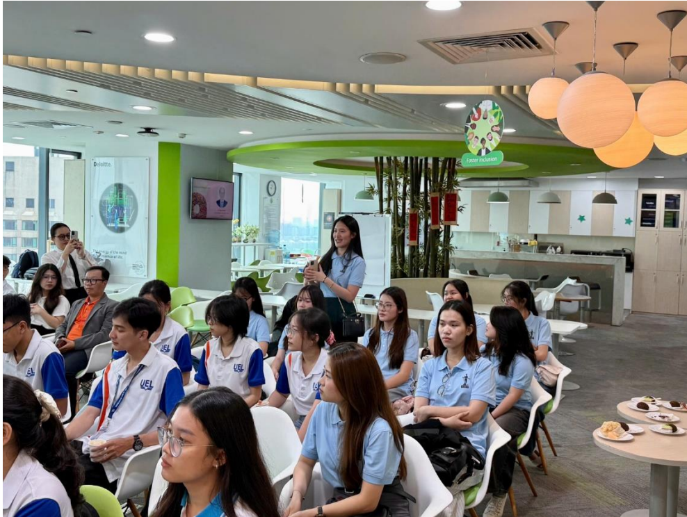
Sinh viên ICAEW UEH mạnh dạn đặt các câu hỏi về môi trường làm việc tại Deloitte