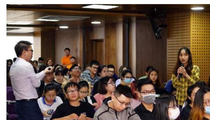
ĐH HOA SEN