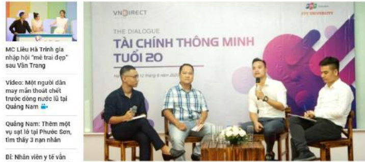
MC Liêu Hà Trinh giá nhập hội "mê trai đẹp" sau Văn Trang Video: Một người dân may mắn thoát chết trước dòng nước lũ tại Quảng Nam Quảng Nam: Thêm một vụ sạt lở tại Phước Sơn, tìm thấy 3 nạn nhân Bé: Nhân viên y tế vẫn phải làm việc dù dương tính với Covid-19 BAC A BANK mở rộng

Nhịp sống trẻ - 14/06/2020 09:46 Đinh Trung Thích 0 Chia sẻ TTTĐ - Trường Đại học FPT vừa tổ chức buổi workshop "Tài chính thông minh tuổi 20". Chương trình giúp sinh viên quản lý cũng như phát triển tài chính cho bản thân mình, đặc biệt là định hướng cho bạn trẻ cách chi tiêu hợp lý với mức lương bình thường.