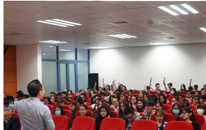
ĐH KINH TẾ QUỐC DÂN