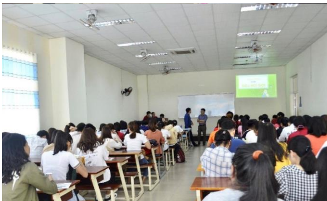
ĐH NGÂN HÀNG