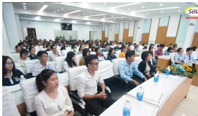
ĐH KINH TẾ HCM