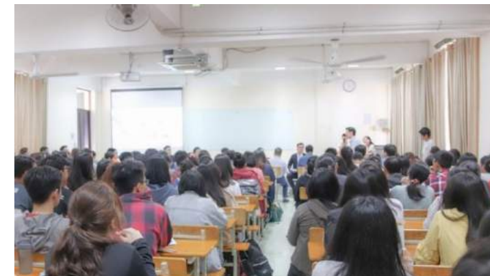
ĐH NGOẠI THƯƠNG