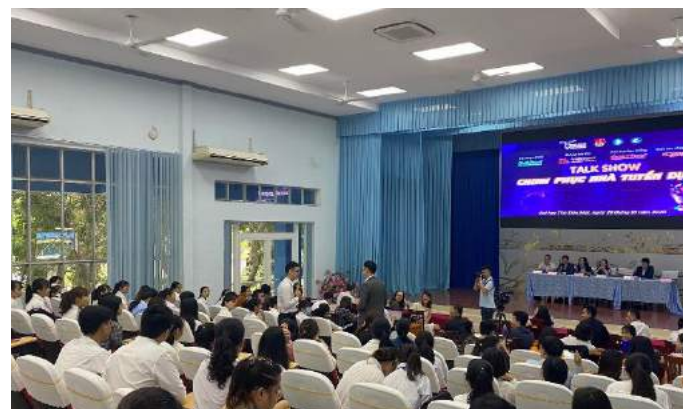
ĐH THỦ DẦU MỘT