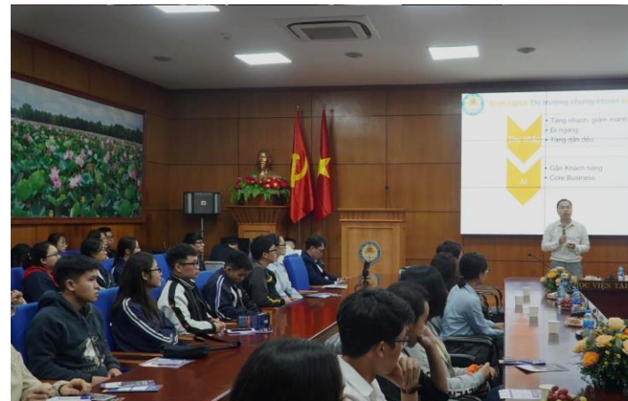
HV TÀI CHÍNH