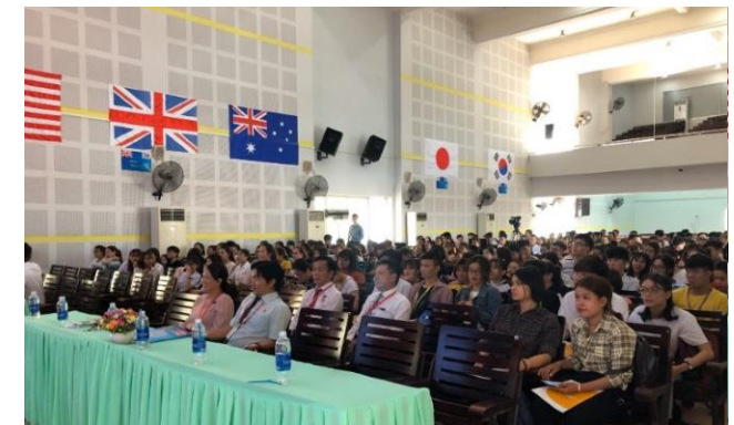
ĐH BÌNH DƯƠNG