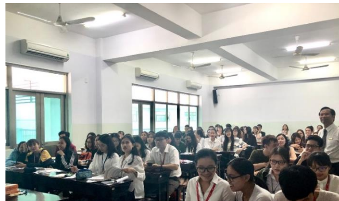
ĐH TÔN ĐỨC THẮNG