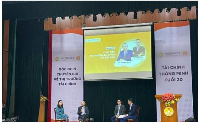
HV NGÂN HÀNG